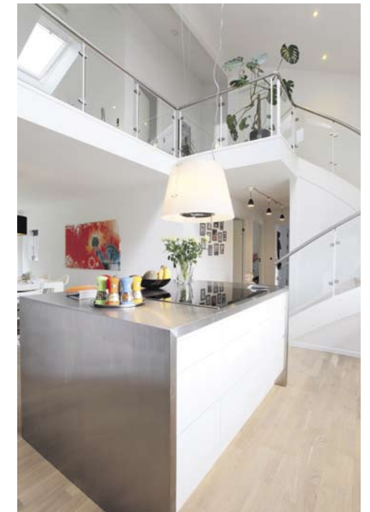
Trappen til 1. sal er med lukkede trin og partieme under gelænderet af glas af hensyn til Antons sikkerhed.